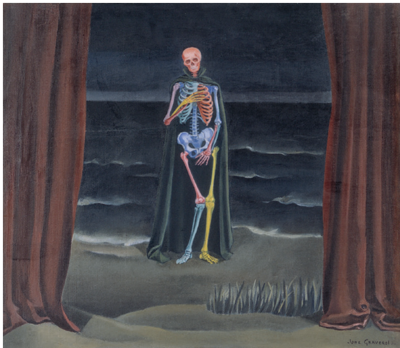
Jane Graverol, L'Éternel retour , 1955. Charleroi, Collection de la Province de Hainaut - Dépôt au BPS22