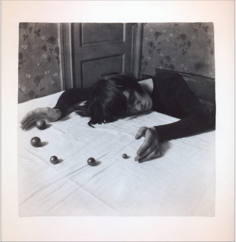
Paul Nougé, La Jongleuse, de la série Subversion des images, 1929-1930. Collection Archives & Musée de la Littérature (AML), Bruxelles.