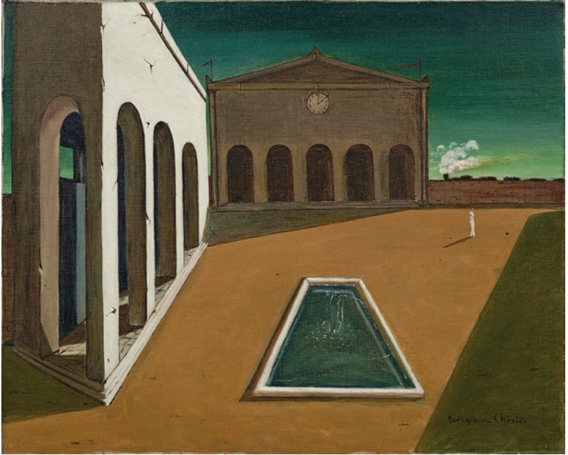
Giorgio de Chirico, Les Plaisirs du poète , 1912, Esther Grether Family Collection.