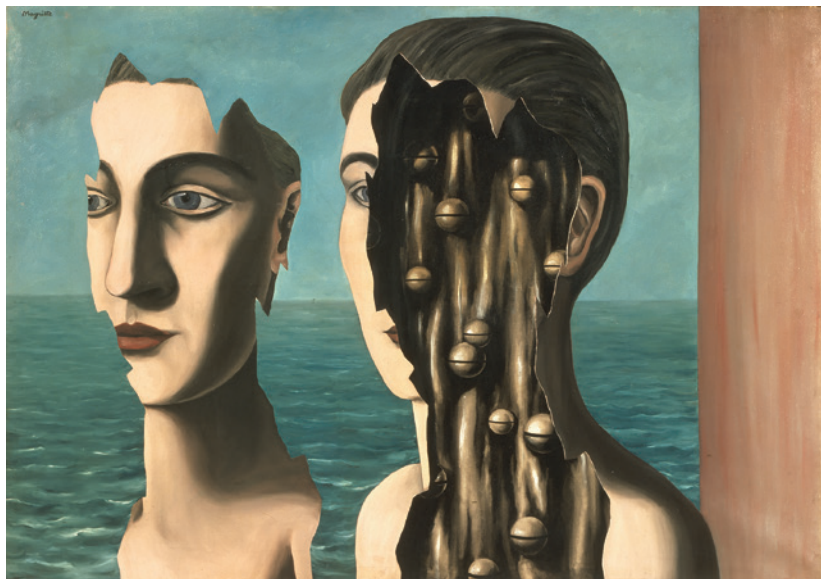
René Magritte, Le Double secret , 1927, Paris, Centre Pompidou – Musée national d'art moderne – Centre de création industrielle, inv. AM 1980-2.