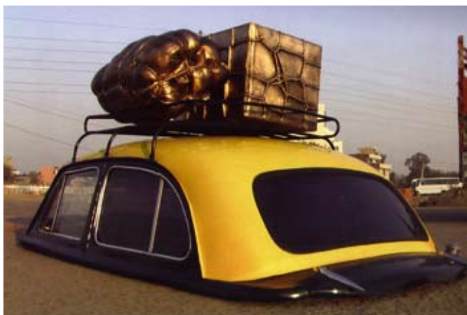
Subodh Gupta, Everything is inside , 2004, Verzamelings| Collection Arario.