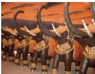
La Rambla des éléphants, Nitin Desai © Nitin Desai Studios, Bombay, 2006