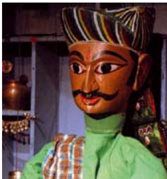
Théâtre en Tête