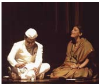
Sammy! The word that broke an empire