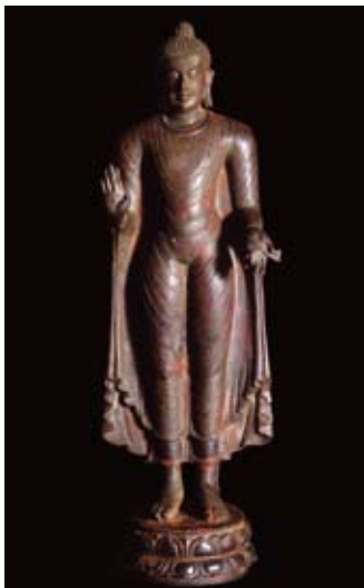
Buddha: Pala, X e , Nalanda, Bihar

Din > zon | Mar > dim | Tue > Sun 10:00 > 18:00