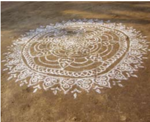
Kolam ritual

EN/ In the performing arts, Kathakali is as important in India as Nô theatre is in Japan. To such an extent that Unesco has declared it to be part of the world's cultural heritage. At once dance and theatre, Kathakali is, above all, an ancient ritual phenomenon with its roots in Kerala in southern India. You can discover every aspect of Kathakali, from the preparations to a performance lasting six hours! Stunning costumes, iridescent makeup, exquisite masks, and strictly codified facial expressions: everything in Kathakali contributes to bringing the mythical tales of the Mahabharata vividly to life. The Pulluvan from Kerala will perform – for the first time outside India – their Kalam Ezhuttu Pâttu ritual, in which two women in a trance trace and erase drawings on the ground, using multicoloured sands. A truly colourful event!