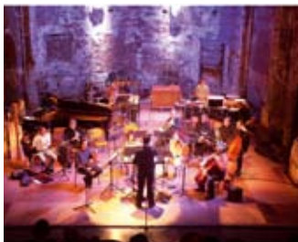
Ensemble Musiques Nouvelles