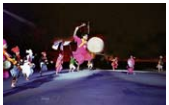
Drums of Manipur