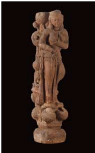
Lakshmi: Kushana, II e , Mathura, Uttar Pradesh