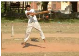
Cricket: the basics