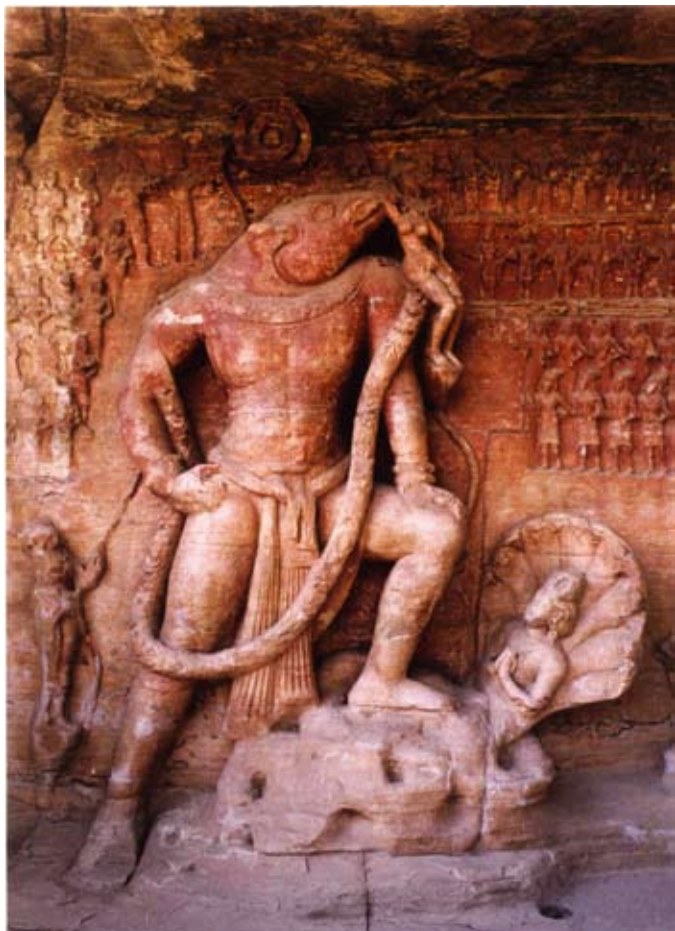
Varaha: Gupta, IV e , Udaigiri cave 5, Madhya Pradesh