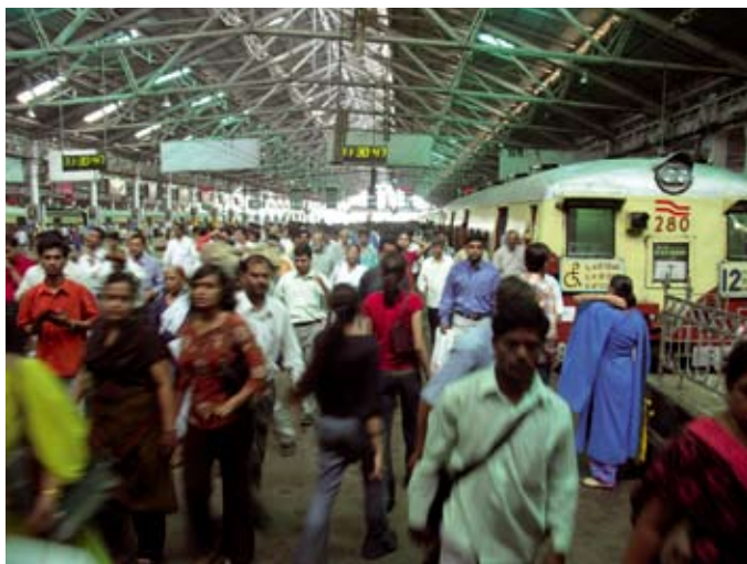
Gare de Mumbai