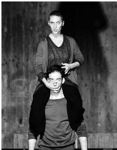
SILENT SONGS into the wild.