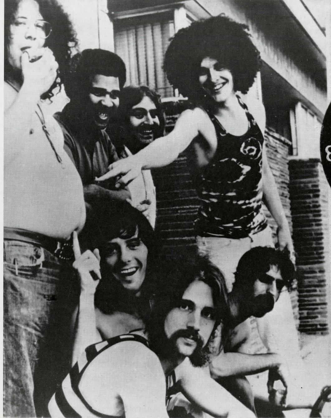
THE MOTHERS OF INVENTION