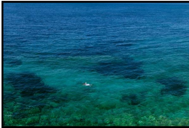
Panos Kokkinias, Yiorgis, 2011, 120x180 cm, digital Inkjet Print on Epson Archival Fine Art Matte, © Panos Kokkinias, courtesy the artist and Xippas Gallery

In het kader van Focus on Greece , een brede waaier aan activiteiten rond Griekenland, brengen het Paleis voor Schone Kunsten en curator Katerina Gregos een tentoonstelling die de Griekse crisis ondervraagt doorheen een uitzonderlijke selectie van recente en nieuwe hedendaagse kunstwerken . No Country for Young Men overstijgt het abstracte van de cijfers, de economische vraagstukken en het begrotingstekort, en concentreert zich op de menselijke en sociale dimensie. No Country for Young Men is de belangrijkste uiting van hedendaagse kunst van de voorbije tien jaar buiten Griekenland en is de eerste in zijn soort over de crisis .