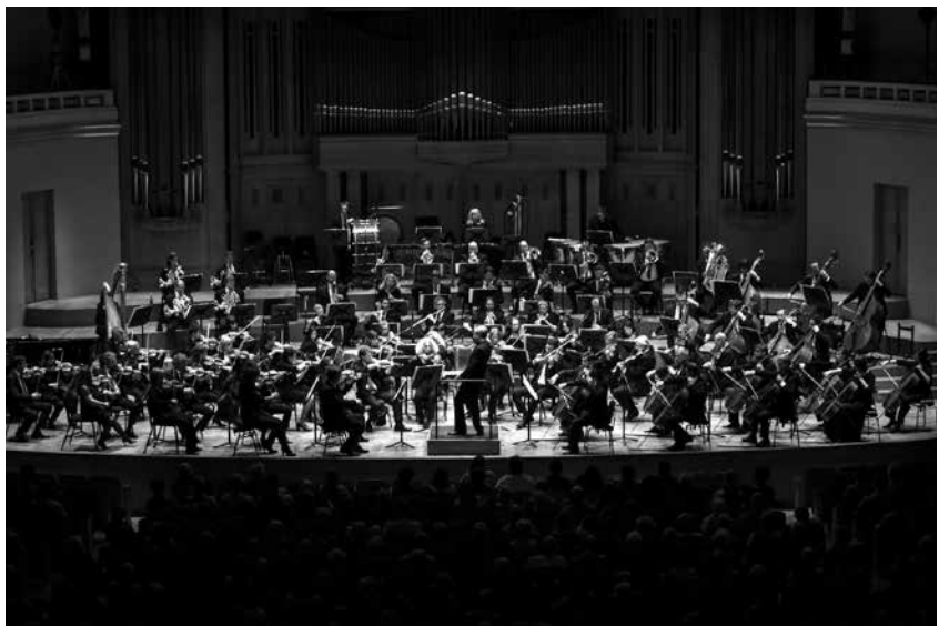
BNO © Veerle Vercauteren