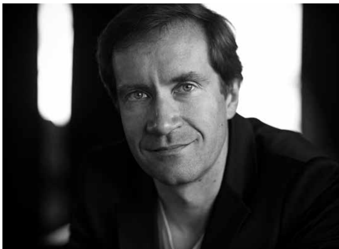
Nikolai Lugansky