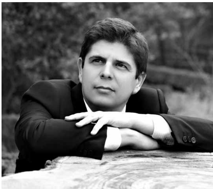
Javier Perianes