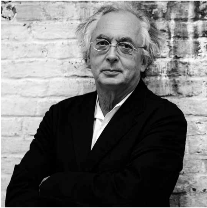
Philippe Herreweghe