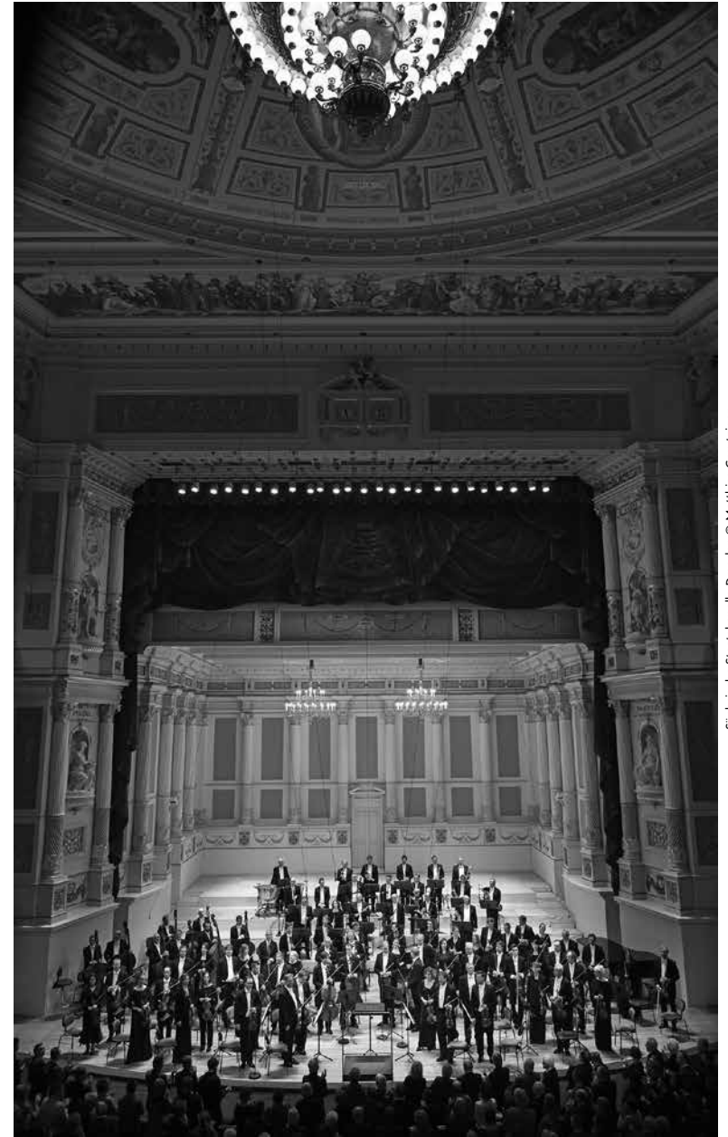
Sächsische Staatskapelle Dresden