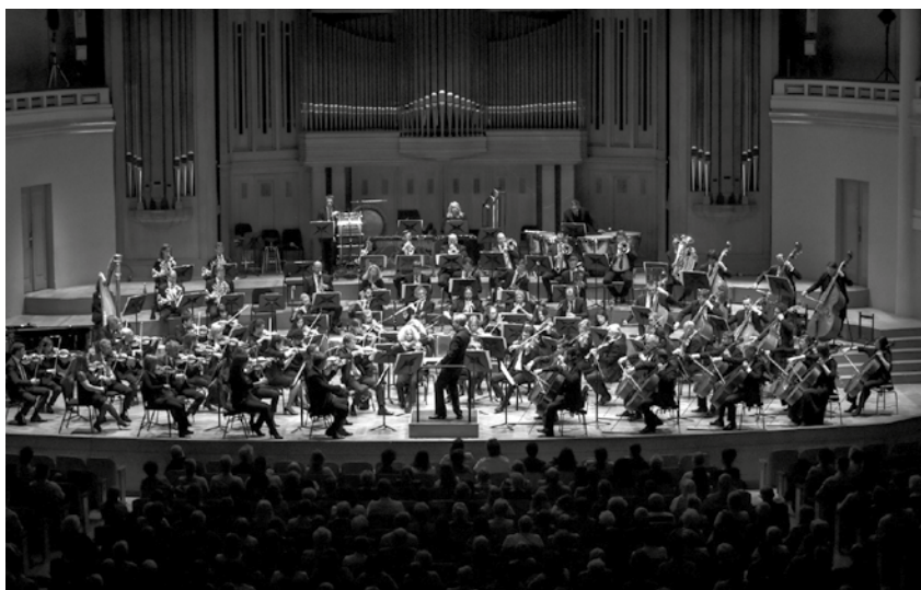
Belgian National Orchestra