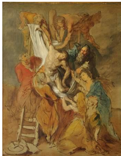
Thomas Gainsborough, The Descent from the Cross, After Rubens, 1766-69, Gainsborough's House, Sudbury