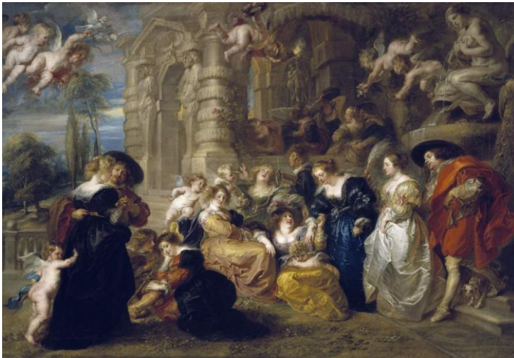
Peter Paul Rubens, The Garden of Love, c. 1633, © Museo Nacional del Prado Madrid

Naast de eerder genoemde belangrijke bruikleengevers uit het buitenland zijn er o.a. Tate Britain (Londen), de Neue Pinakothek (München), de Nasjonalgalleriet (Oslo), Koningin Elisabeth II en ook privécollecties.