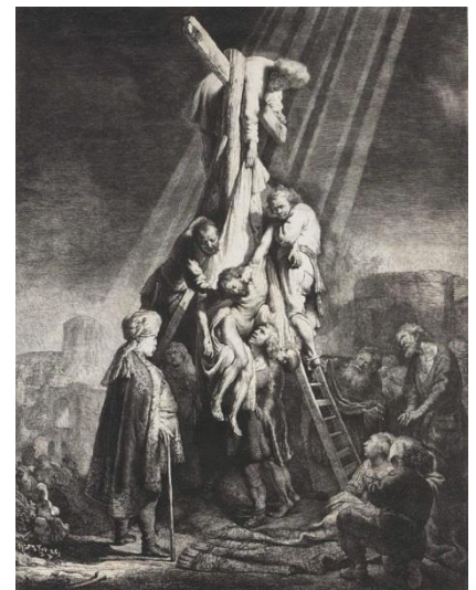
Rembrandt Harmensz van Rijn, Descent from the Cross, 1633, Rijksmuseum Amsterdam