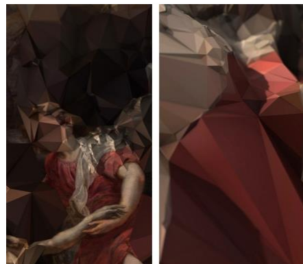
Quayola, Strata #4 , 2011, Audiovisual Installation

De altaarstukken van Rubens en Van Dyck lijken ver weg van onze tijd te staan. Met de installatie Strata #4 brengt de Italiaanse hedendaagse kunstenaar Quayola een harmonieuze dialoog tot stand tussen toen en nu. Met speciale software zet hij symbolen van universele schoonheid en perfectie om in triggers en instructies om nieuwe hedendaagse kunst te creëren. Hij reduceert de oude kunst tot de essentie, naar kleuren en geometrische vormen en ontdoet ze van hun symboliek.