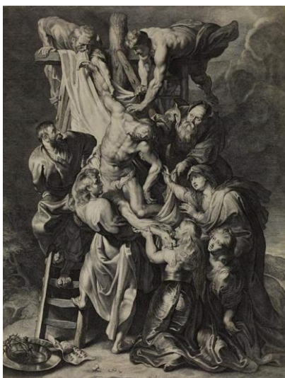
Lucas Vorsterman, The Descent from the Cross, 1620, British Museum London