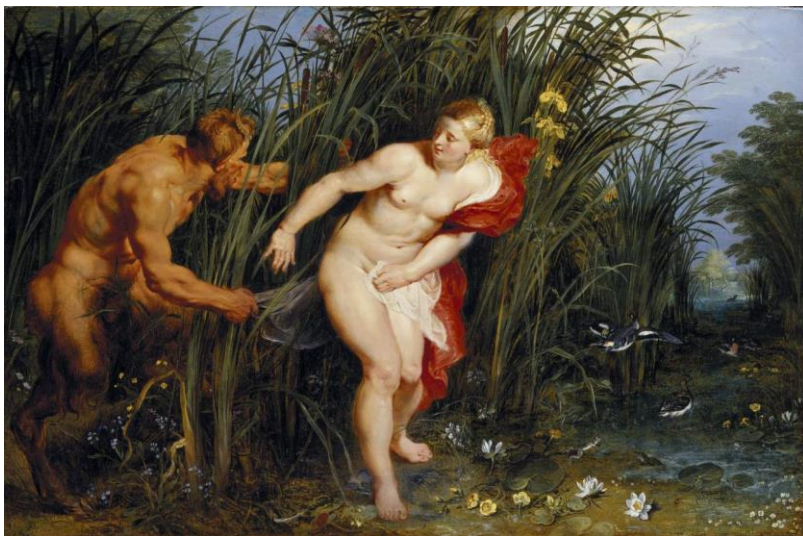
Peter Paul Rubens, Pan and Syrinx , 1617, © Staatliche Museen (Kassel), Photo Ute Brunzel

Peter Paul Rubens was een van de meest vernieuwende schilders in de kunstgeschiedenis. Zijn impact op de generaties na hem is immens. Voor het eerst onderzoeken het Koninklijk Museum voor Schone Kunsten Antwerpen (KMSKA), de Royal Academy of Arts Londen en BOZAR Brussel Rubens als rolmodel. De tentoonstelling Sensatie en Sensualiteit. Rubens en zijn erfenis brengt zo'n 160 werken samen: iconische schilderijen van Rubens, maar vooral ook van zijn artistieke erfgenamen.