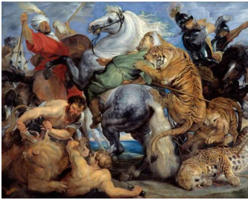
Peter Paul Rubens, The Tiger Hunt, 1616, Musée des Beaux-Arts Rennes

Heel wat getalenteerde kunstenaars lieten zich verleiden door Rubens' gebruik van compositie, kleur of techniek en kwamen op die rijke voedingsbodem tot rijpheid en bloei. Na zijn ontmoeting met Rubens ging Velázquez anders schilderen en gebruikte hij op diens aanwijzing een lichtere grondlaag.