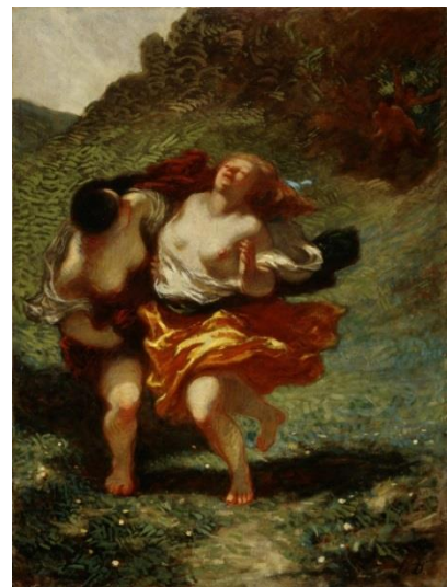
Honoré Daumier, Woman Pursued by Satyrs, 1850

Het is een paradox dat Peter Paul Rubens (1577-1640) onnavolgbaar zou zijn, en toch al vier eeuwen lang tot ver buiten Europa hét grote voorbeeld is voor schilders als Rembrandt, Murillo, Watteau, Fragonard, Gainsborough, Reynolds, Delacroix, Cézanne, Renoir, Kokoschka en vele anderen. Zelfs in het oeuvre van Picasso vinden we zijn beeldtaal terug. De internationale tentoonstelling Sensatie en Sensualiteit. Rubens en zijn erfenis toont dit fenomeen en haalt werk van deze illustere kunstenaars naar het thuisland van de wereldvermaarde Vlaamse meester.