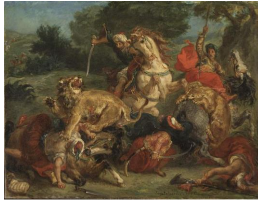
Eugène Delacroix, The Lion Hunt, 1855, Nationalmuseum Stockholm, Photo: Hans Thorwid, Nationalmuseum, Sweden