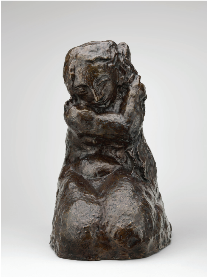
Pablo Picasso, Zich kappende vrouw , 1906. Musée national Picasso-Paris © Succession Picasso - SABAM Belgium 2016.