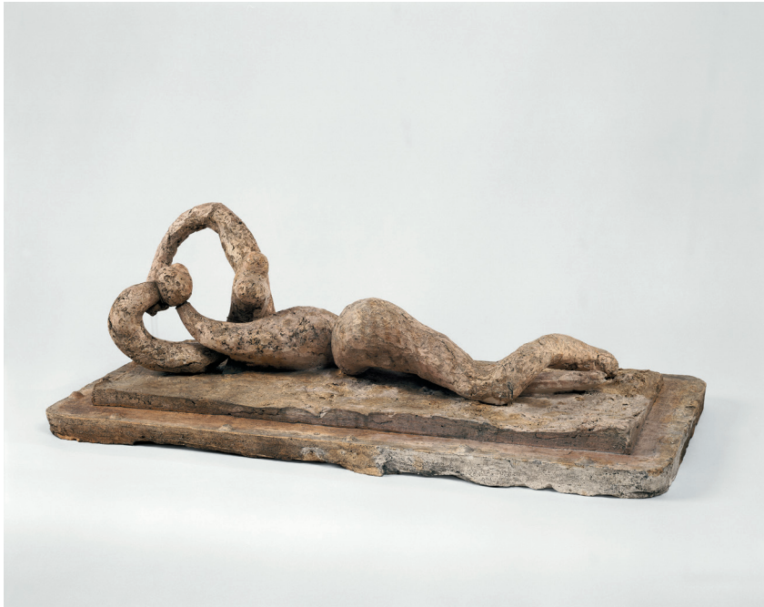
Pablo Picasso, Liggende baadster , 1931. Privécollectie.