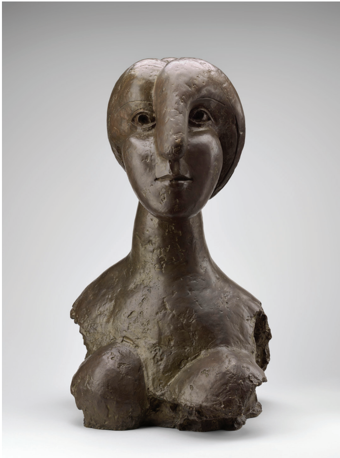
Pablo Picasso, Vrouwenbuste , 1931. Musée national Picasso-Paris © Succession Picasso - SABAM Belgium 2016.