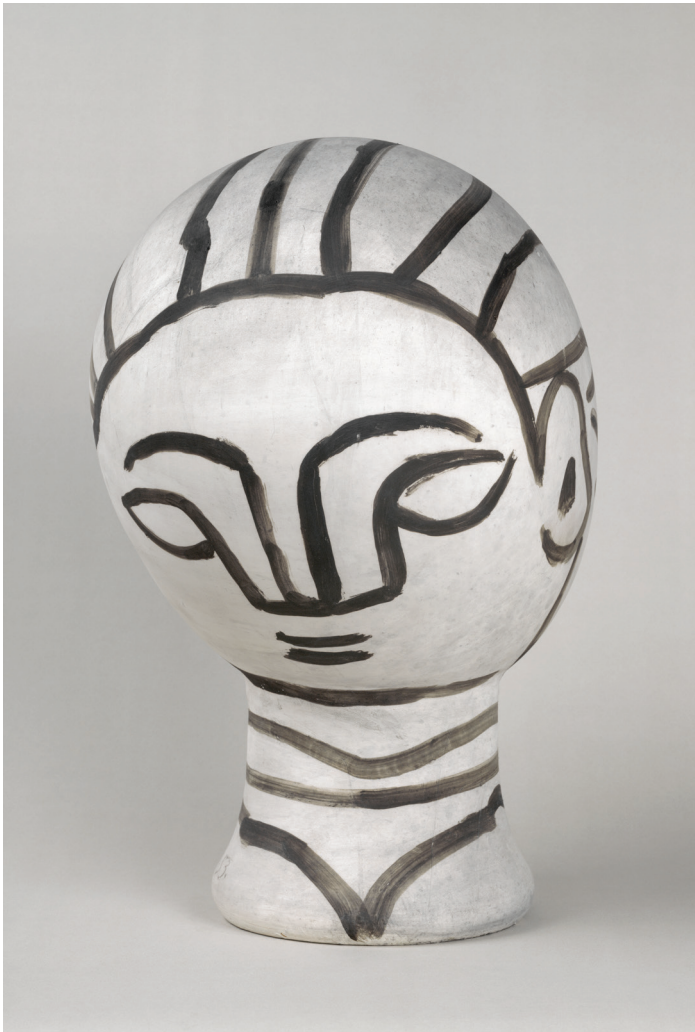
Pablo Picasso, Vrouwenkop , 1953. Musée national Picasso-Paris © Succession Picasso - SABAM Belgium 2016.