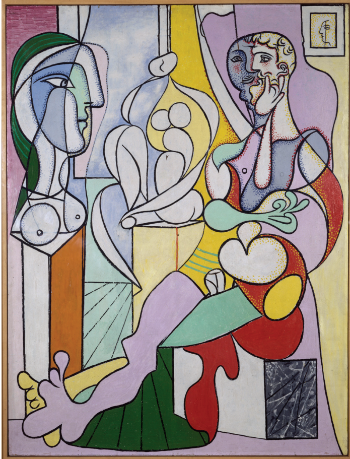
Pablo Picasso, Beeldhouwer , 1931. Musée national Picasso-Paris © Succession Picasso - SABAM Belgium 2016.