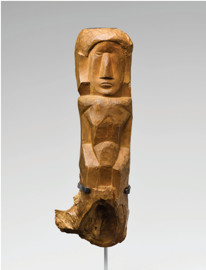
Pablo Picasso, Figuur , 1907. Musée national Picasso-Paris © Succession Picasso - SABAM Belgium 2016.