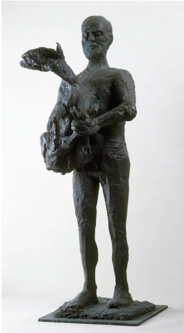
Pablo Picasso, Man met schaap , 1943 Musée national Picasso-Paris © Succession Picasso - SABAM Belgium 2016.