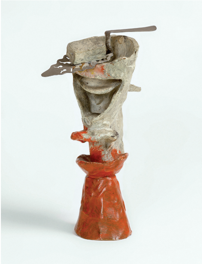
Pablo Picasso, Absintglas , 1914. Privécollectie. Courtesy Fundación Almine y Bernard Ruiz-Picasso para el Arte © Succession Picasso - SABAM Belgium 2016. © FABA. Foto Eric Baudouin