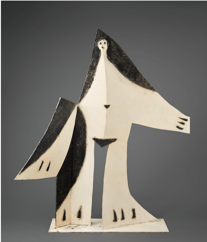
Pablo Picasso, Vrouw met gespreide armen , 1961. Musée national Picasso-Paris © Succession Picasso - SABAM Belgium 2016.