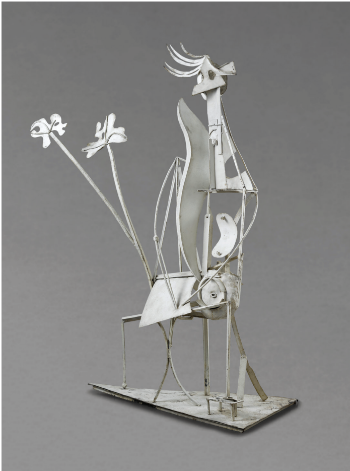
Pablo Picasso, Vrouw in tuin, 1929-1930. Musée national Picasso-Paris