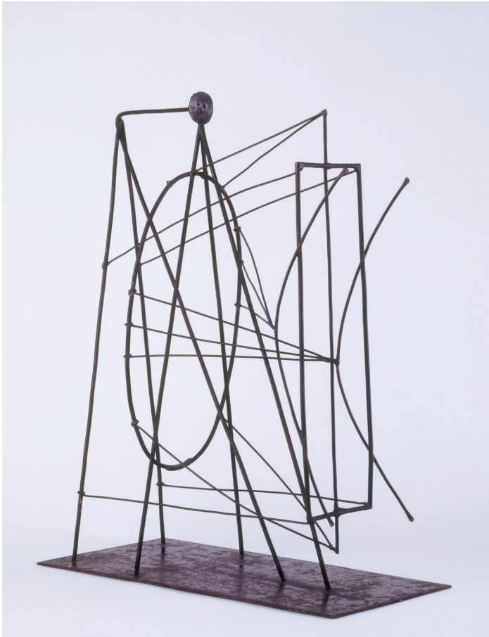
Pablo Picasso, Figuur , 1928. Musée national Picasso-Paris © Succession Picasso - SABAM Belgium 2016. Foto © RMN-Grand Palais (musée Picasso de Paris) / Béatrice Hatala