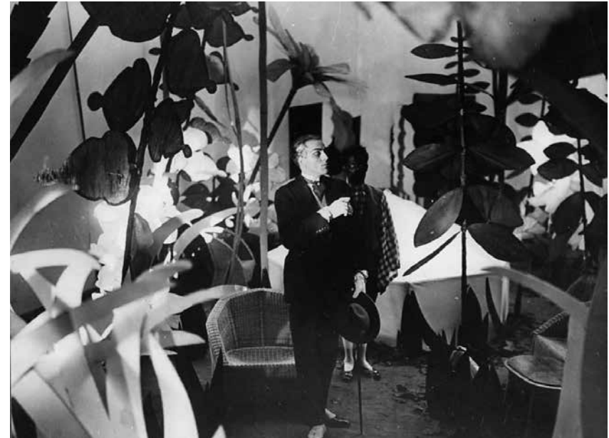
L'inhumaine directed by marcel l'herbier

in het kader van de tentoonstelling · dans le cadre de l'exposition Fernand Léger. Schoonheid alom · Fernand Léger. Le Beau est partout