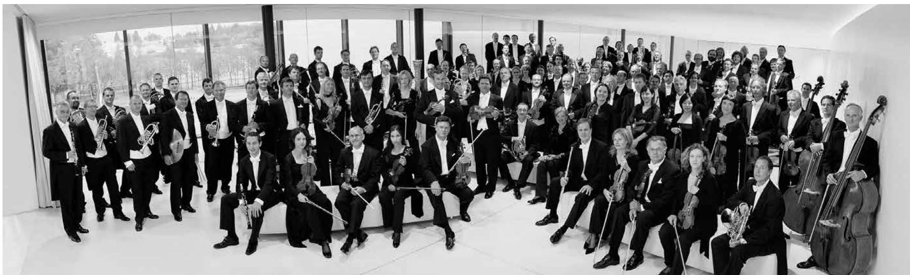
Wiener Symphoniker