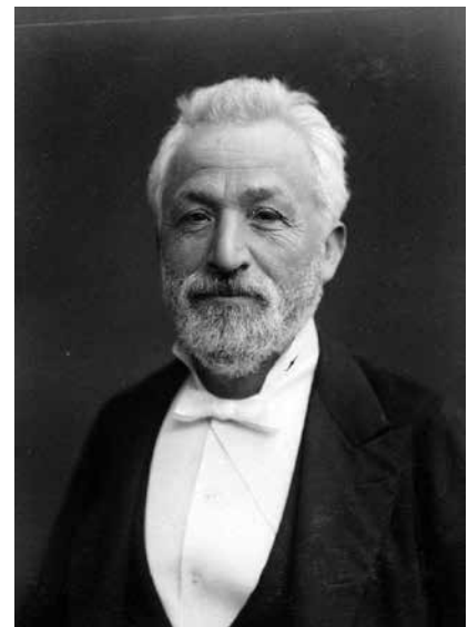
Portrait de Gaetano Braga par Nadar - Portrait van Gaetano Braga door Nadar

Gaetano Braga crée son premier opéra à Naples en 1853, puis passe les vingt années suivantes entre Paris et Londres. Huit autres opéras voient le jour, créés dans des villes telles que Vienne, Paris, Milan, Lecco et Lisbonne. Se voyant refuser la création de son