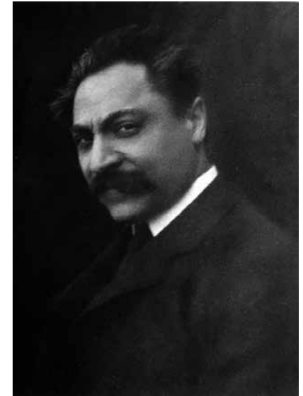
Giuseppe Martucci

Hoewel Giuseppe Martucci een ondergesneeuwde figuur is in de muziekgeschiedenis, was hij een belangrijke muzikale persoonlijkheid in het 19e-eeuwse Italië. Hij droeg bij tot het herstel van de traditie van het Italiaanse concert op een moment dat