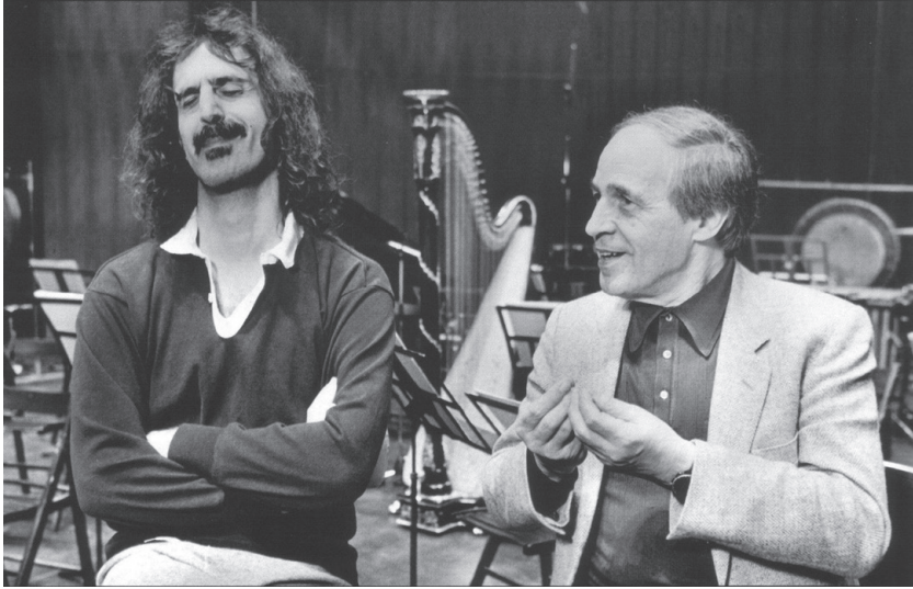
Frank Zappa & Pierre Boulez